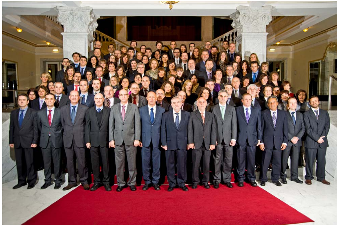
Distribución de nuestro equipo de profesionales por áreas: